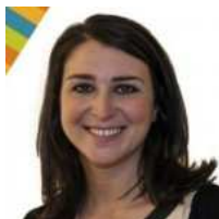
VITERBO/Due indagati per il buco di Esattorie