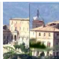
SUBIACO/Crollo del tetto della Rocca Abbaziale. Berteletti (PdL): “L’Amministrazione non...