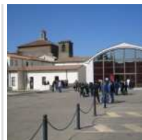
Ambiente: da università Tuscia “dottore” in infrastrutture verdi